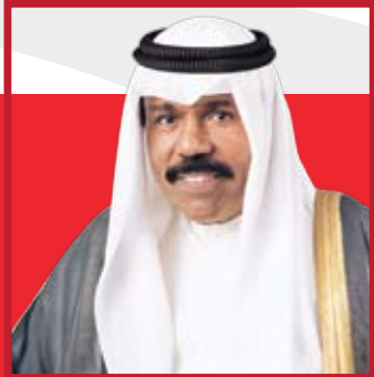
سَيِّدُ الشُّعْبِ نَوَافُ بْنُ عَبْدِ الرَّحْمَنِ السَّبَّاحِ وَلِيَّ عَهْدِ كُوَيْتِ