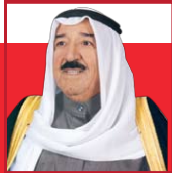
مَلِكُ الشُّعْبِ سَبَّاحُ بْنُ عَبْدِ الرَّحْمَنِ السَّبَّاحِ أَمِيرُ دَوْلَةِ كُوَيْتِ